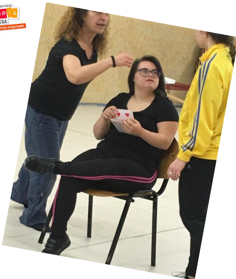
LABORATORIO LUDICO ESPRESSIVO