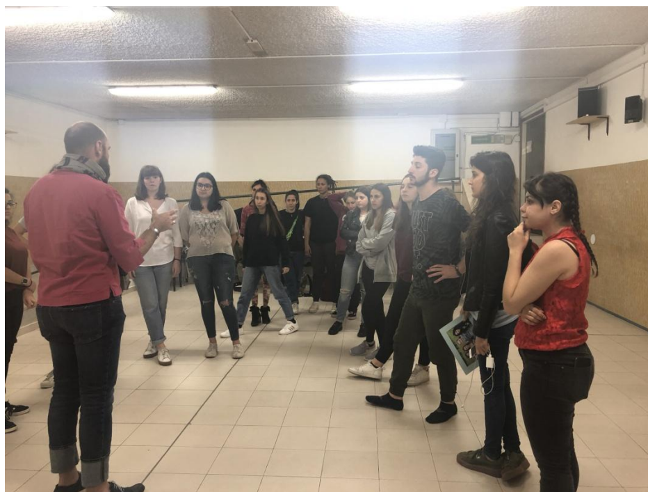
Cooperativa nell'evento finale.